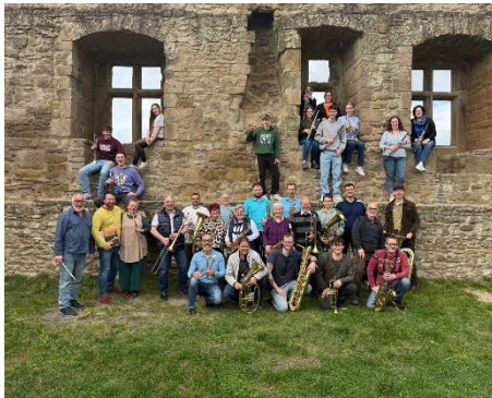
Der Musikverein Schneckenhausen ist beim Auftaktkonzert und bei der Langen Nacht der Musik im Einsatz.